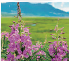
ヤナギラン抽出物