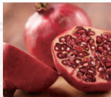
ザクロ果実エキス末