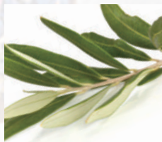
オリーブ葉エキス末