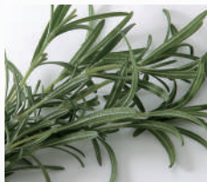
ローズマリーエキス末